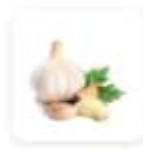
1 gousse d'ail