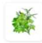
3 c.à.s de fines herbes