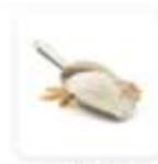
1 tasse de farine